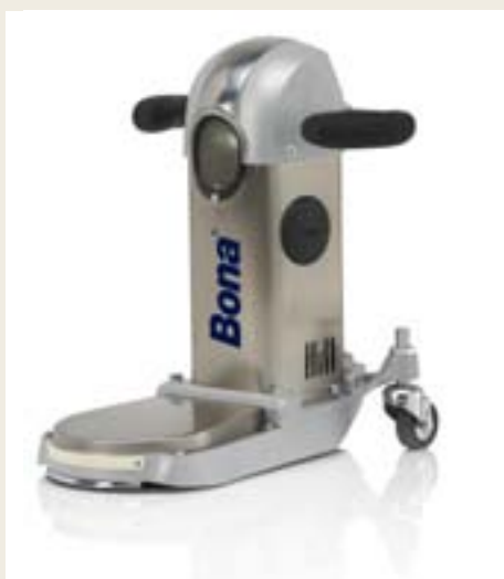
Scheibendurchmesser 178 mm