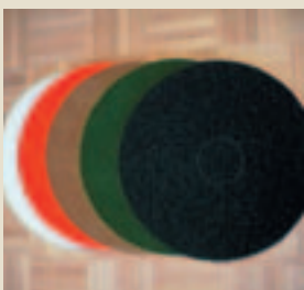
Bodenreinigungsscheiben Floor Pads für sämtliche Reinigungs-, Polier- und Ölarbeiten.