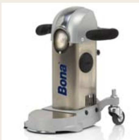
Scheibendurchmesser 178 mm