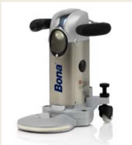
Scheibendurchmesser 150 mm