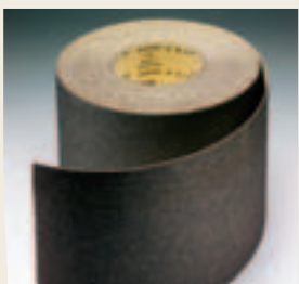
1707 siapar Rollen , spezielle Serie für den Fussbodenschliff mit angepasster Unterlage. Grobschliff mit stabiler Baumwollunterlage, Mittel- und Feinschliff mit Papierunterlage.